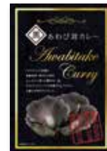
黒あわび茸カレー