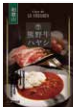
熊野牛ハヤシソース