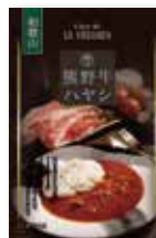
熊野牛ハヤシソース

赤ワインとトマトをたっぷり使用した熊野牛のハヤシソースと、まろやかでコクのあるチキンカレーをセットでご用意しました。いずれも当社オリジナルです。