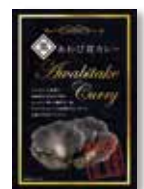
黒あわび茸カレー