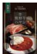
熊野牛ハヤシソース