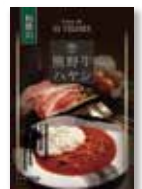
熊野牛ハヤシソース