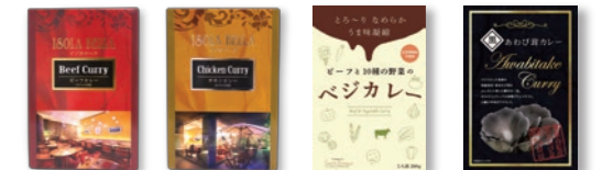
ビーフカレー チキンカレー ベジカレー 黒あわび茸カレー

まろやかでコクのある当社オリジナルビーフカレー・ チキンカレーと、新商品のビーフと様々な野菜を 組み合わせたベジカレー、大ぶりの黒あわび茸を贅沢に 使用したスパイシーなカレーをセットでご用意しました。