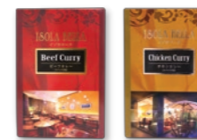
ビーフカレー チキンカレー