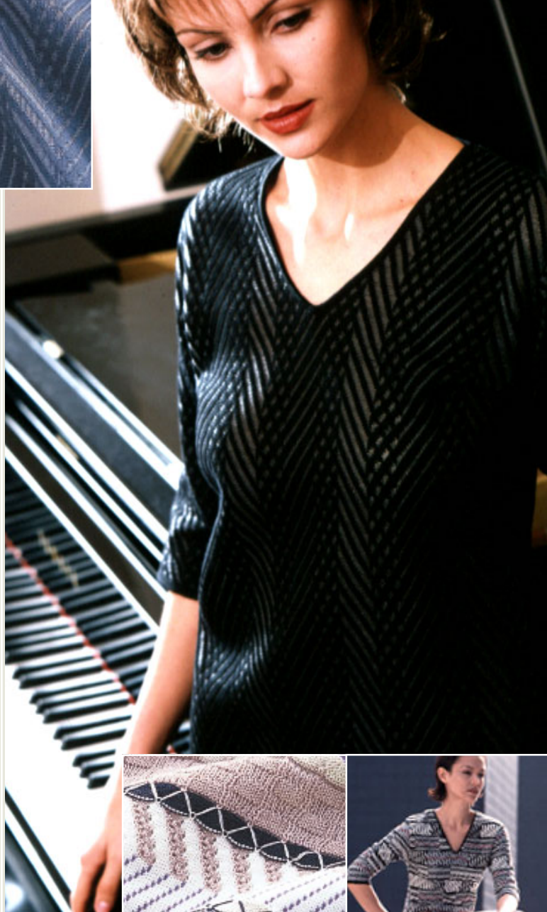
Shimatronic® Knitting Technology